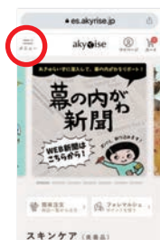
① TOP ページから