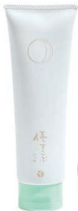
洗い流すパック 「優すくらぶ」