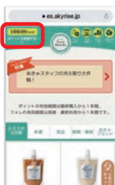
③ ログイン後、ポイントをフォレに両替