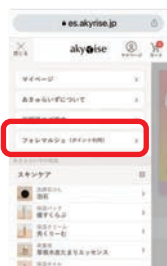
② フォレマルシェを選ぶ