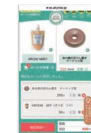
④ カタログから商品を選んでカートに入れてお買い物