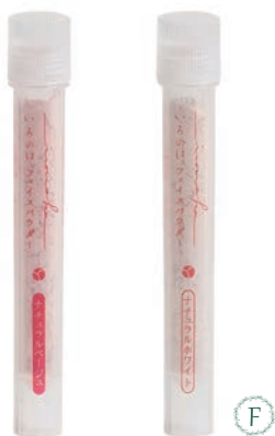
ナチュラル ベージュ